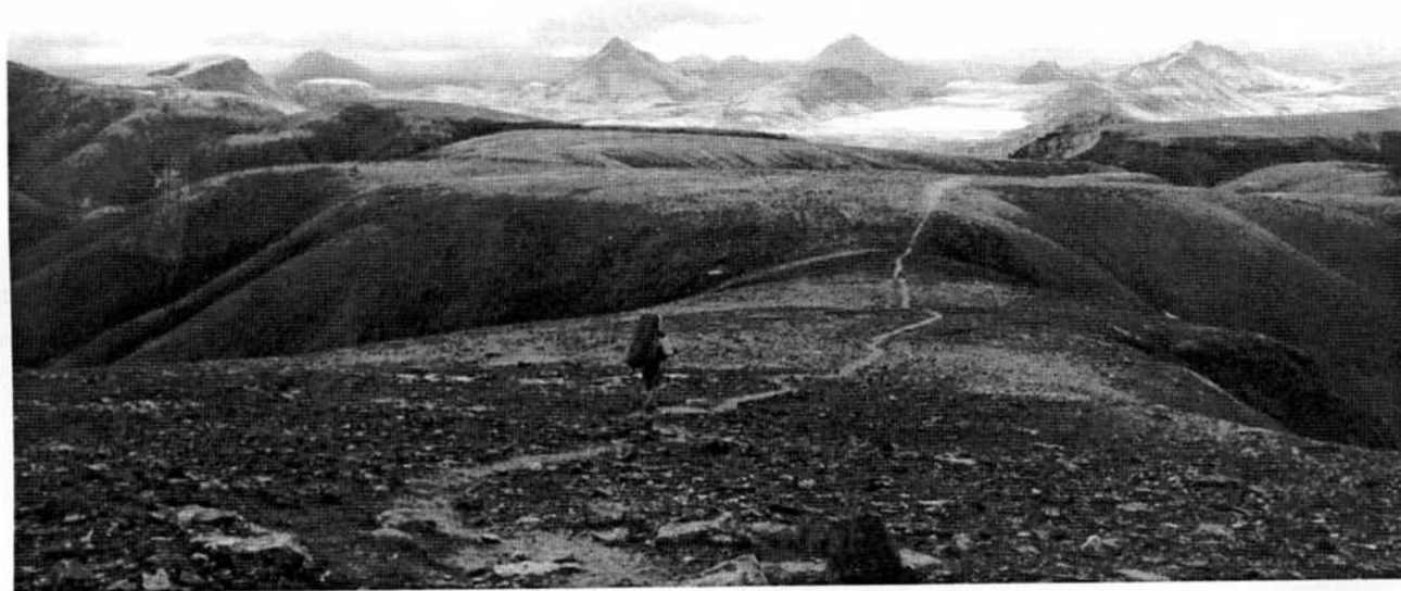
« Territoire aux limites floues... »

2 – Un sens sociologique : où liminalité pourrait être remplacée par marginalité. Être à la marge, position intermédiaire entre le dehors et le dedans de la